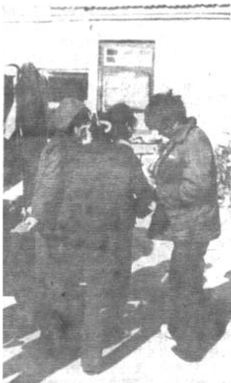
入冬以来，一些农民进城，公开地做着粮票生意。他们低价收进，高价卖出，一斤粮票，转手价格高达4角钱，从中牟取暴利。国家明文规定，粮票不得买卖。有了明确条文，但却禁而不止，此事谁来管？久而久之，粮票黑市会给我市的票证管理带来麻烦，严重扰乱粮食市场。图为笔者12月8日上午在我市济南路拍到的一个镜头，卖者与买者正在讨价还价。